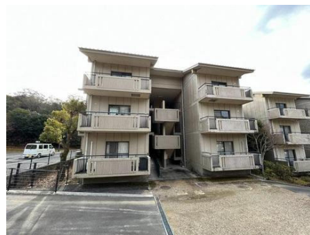
外観 北東側より見る